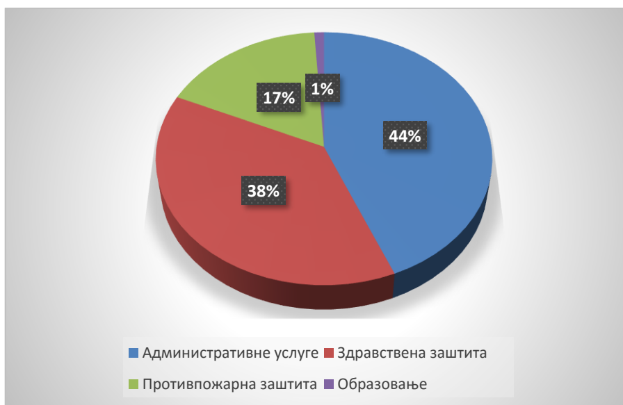
Графикон 2: Секторска структура крајњих корисника пројектних резултата у оквиру Приоритетне области 1 – јавне услуге

Као резултати Финансијског механизма у подручју јавних услуга , Позивом јединицама локалне самоуправе за подношење приједлога пројеката зацртани су „унапријеђење квалитета и доступности јавних услуга на локалном нивоу у најмање четири (4) јединице локалне самоуправе и позитиван утицај на квалитет живота најмање 20.000 становника на овим локалитетима.“ Очигледно је да су остварени резултати у оквиру Приоритетне области 1 вишеструко надмашили очекивања са почетка процеса имплементације 2. годишњег циклуса финансирања.