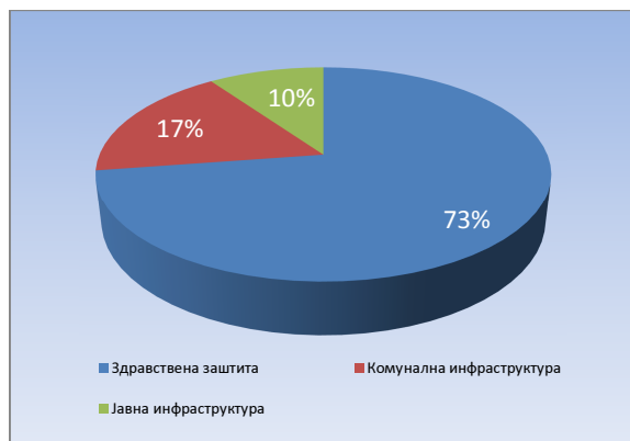
Графикон 2: Секторска структура крајњих корисника пројектних резултата у оквиру Приоритетне области 1 – јавне услуге

Кроз финансирање одобрених пројеката у подручју „ руралног развоја ,” постигнути су следећи резултати и ефекти: